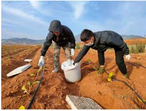
图 1 不同药剂的灌根（会理）