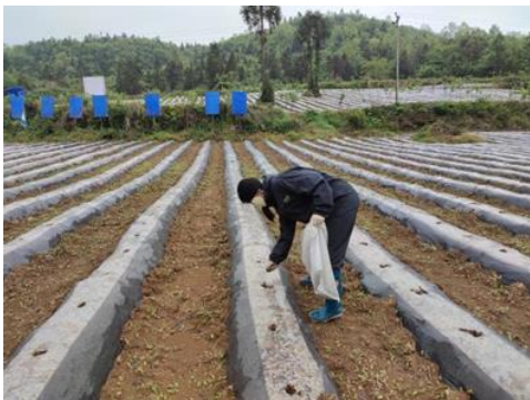
图 7 驻点人员施用自制微生物菌剂（彭水）

为切实推进落实彭水地区基于微生态调控防治烟草青枯病技术集成示范应用和 2021 年度品种项目试验工作稳步推进，西南大学烟草植保团队成员龚杰和刘慧迪于本周开展核心示范区施用有益微生物菌剂、品种项目的补苗工作及降解 4-羟基苯甲酸的细菌与拮抗细菌协同作用对烟草青枯病和黑胫病的调控作用小区试验。5 月 4 日-5 月 9 日，西南大学烟草植保团队成员龚杰和刘慧迪在白果坪地块完成实验室自制微生物菌剂的施用和部分品种的补苗工作并完成雪茄烟小区标牌的书写工作。