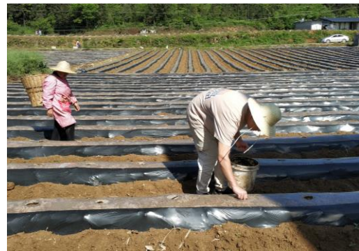
图 24 驻点人员正进行小区实验（酉阳）

在巫山基地本周已完成不同剂量的牡蛎钾粉对土壤酸碱度及烟草根茎病害发生的影响处理以及微生物有机肥对烟草生长发育及根茎病害发生的影响处理，因移栽时阳光充足，气候温度较高，因此移栽时要求烟农把窝打的深一些，进行小孔深栽，避免因阳光暴晒导致烟叶枯萎。彭水基地目前示范区全部移栽完毕，白果坪坡上微生物菌剂施用工作已完成。有益微生物菌剂试验及降解 4-羟基苯甲酸的细菌与拮抗细菌协同作用对烟草青枯病和黑胫病的调控作用试验已开展