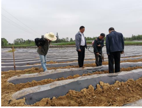
图 39 驻点人员同烟站胡站长考察烟苗情况