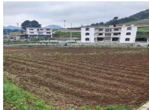
图 14 小区试验地地起垄完毕（贵州）