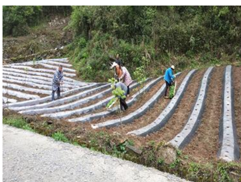
图 37 移栽正在进行中（巫山）

巫山基地，为保证“新品类卷烟核心原料 BF0/BFF 生产技术体系研究”项目实施，核心示范区已开始，保证示范区各项植保技术方案的落实到位，特别是是移栽期微生物菌肥的落实工作，做到跟烟农不仅交待清楚，还要亲眼看见他们用下去，确保了量足、地够，不少、不漏，争取一次工作到位。