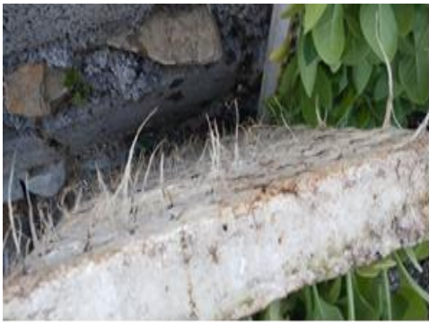
图 27 烟苗根系生长情况（巫山）