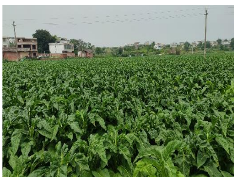
图 19 南雄示范区烟叶长势（广州）