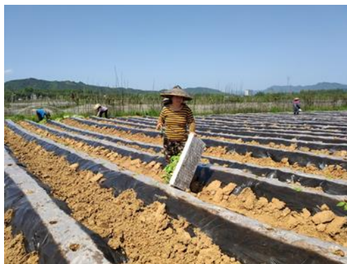
图 29 花垣示范区烟苗移栽（湖南）

在贵州基地截止到目前为时，小区试验地翻地、起垄工作已完毕。后续工作，烟苗移栽近期跟进。湖南花垣基地降解 4-羟基苯甲酸细菌协同拮抗细菌防控烟草青枯病小区试验移栽完成。