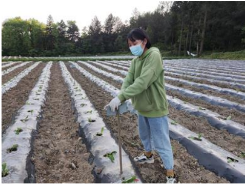
图 25 安装降解菌插牌（彭水）