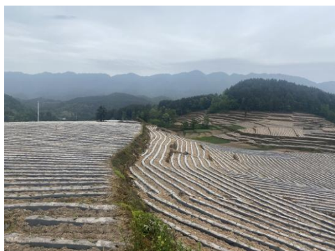
图 35 示范区移栽完成（黔江）

示范区移栽工作已全部完成，共历时三天。标牌制作完成后将放置于适当位置便于标记和展示。