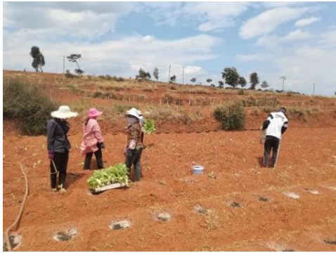
图 21 试验地移栽灌根处理（会理）