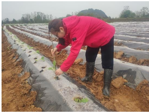
图 9 示范区施用牡蛎钾粉（湖南）