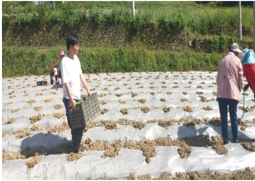
图 31 驻点人员帮助烟农移栽烟苗