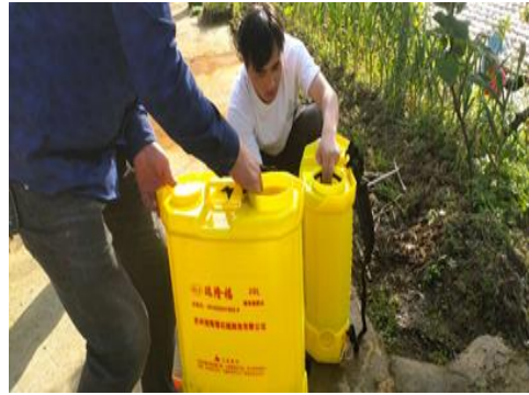
图 32 驻点人员进行小区试验前

在广州基地目前小区烟叶长势良好，小区烟叶株高 95-110cm，19-20 片叶，最大叶长 65-75cm，最大叶宽 35-45cm，未发现青枯病病株，有少量气候斑与花叶病。抗性诱导小区试验已经全部完成，小区未见青枯病发病情况，在第三次的农艺性状调查后发现 BTH 处理和 SC16 处理烟株高于 SC8 和 CK 处理，高出 5cm 左右。