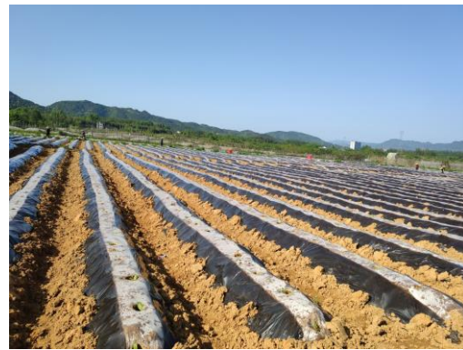
图 30 花垣示范区烟苗移栽完成（湖南）