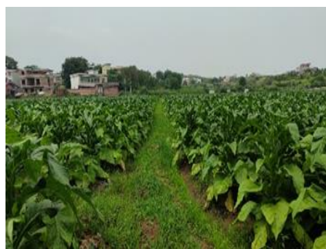
图 20 示范区（左）与对照区（右）（广州）