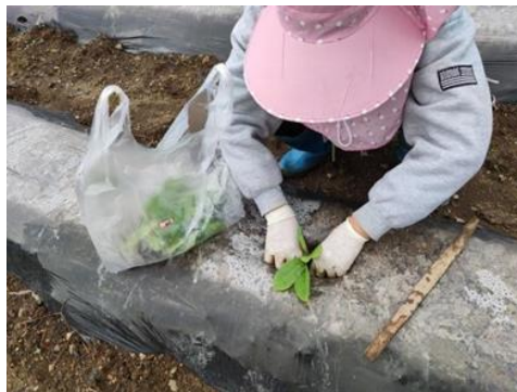
图 8 炮台地块补苗（彭水）

在湖南花垣基地，在烟农的协助下，项目组成员完成了量地和实验小区的划分工作，并按照项目书计划完成田间牡蛎钾粉的施用、油菜饼基肥和三炬有机肥混匀施用、覆膜工作以及“湘西烤烟品种抗病性评价及根茎病害绿色防治”烟苗移栽工作。烟苗移栽前，窝施 10g/株的研究室自制微生物菌肥，再覆盖少量土壤，避免烟苗根部和有机肥直接接触。