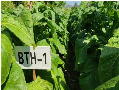
图 33 小区 BTH-1 烟叶长势实况（广东）

在广州基地目前小区烟叶长势良好，小区烟叶株高 95-110cm，19-20 片叶，最大叶长 65-75cm，最大叶宽 35-45cm，未发现青枯病病株，有少量气候斑与花叶病。抗性诱导小区试验已经全部完成，小区未见青枯病发病情况，在第三次的农艺性状调查后发现 BTH 处理和 SC16 处理烟株高于 SC8 和 CK 处理，高出 5cm 左右。