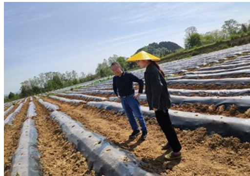
图 10 示范区窝施微生物菌肥（湖南）