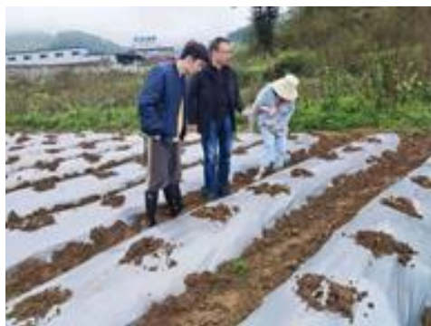
图 15 调查核心示范区软体害虫危害情况（贵州）