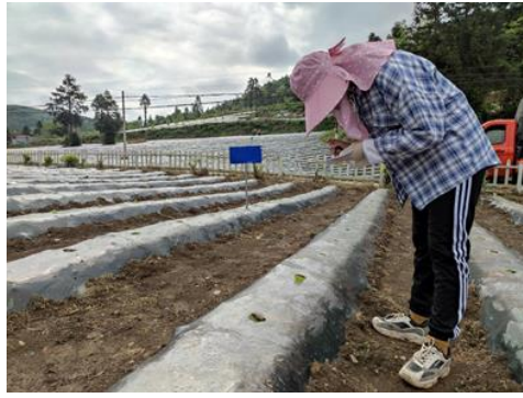
图 26 记录各品种死苗数（彭水）