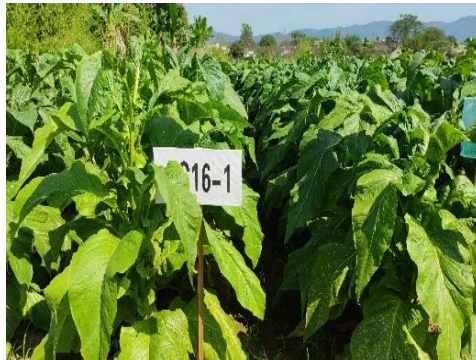
图 34 小区 SC16-1 烟叶长势（广东）