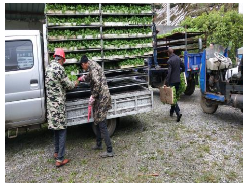
图 4 烟农积极运输烟苗（巫山）

5月3日-5日，为“聚焦单元，做实基地，满足需求”，推进“渝金香品牌‘黄金叶’烟叶质量保障关键技术与集成应用”项目顺利进行，西南大学烟草植保团队首席专家丁伟教授一行到达重庆市黔江区邻鄂镇烟草研究基地，考察了核心示范区的烤烟移栽和科研项目的落实工作，并对驻点学生进行了现场指导。5日中午11:00，重庆市烟草公司黔江分公司烟叶科副科长张学杰一行到达邻鄂镇烟草研究基地，与烟技员冉茂佳、罗春平带领西南大学烟草植保团队成员王珍珍、喻希、麻子君前往示范区调研烟苗移栽和小区试验情况，并指导当地烟农移栽时如何用药。