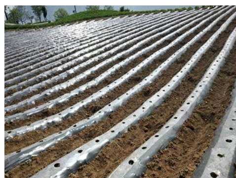
图 38 移栽完成情况（巫山）