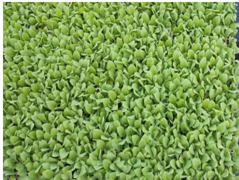
图 28 烟苗叶部生长情况（巫山）

在贵州基地截止到目前为时，小区试验地翻地、起垄工作已完毕。后续工作，烟苗移栽近期跟进。湖南花垣基地降解 4-羟基苯甲酸细菌协同拮抗细菌防控烟草青枯病小区试验移栽完成。